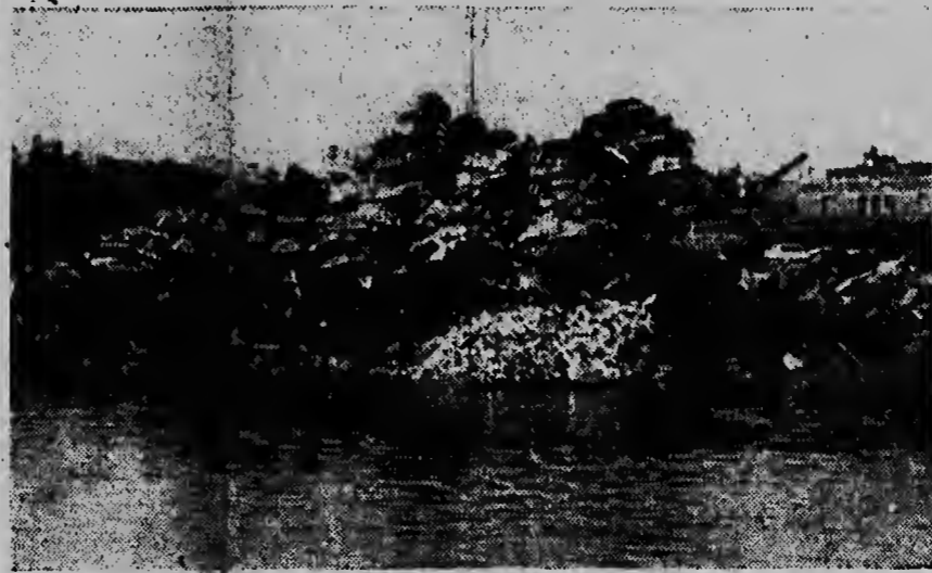
Semper e Neoyorkinonan ta construi nan edificacionnan bai halto, manera boso por mira riba e foto aki, caminda nan a siwa tur e Ford y Cadillacnan for di uso sieto piso halto na un dump banda di East River.

cialmente pa demostra, cu ta posible pa humanidad bishita den universo. Un observatorio na Checoslowakia a informa ayera cu el a mira e segundo satelite ruso cu un telescopio. El a describi e satelite como „un obheto cu ta duna luz y cu ta mes grandi cu un strea di segundo tamanjo”.